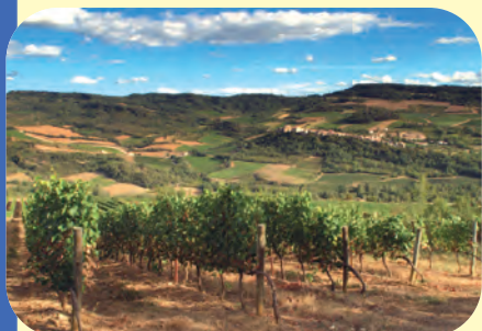
Vignobles autour du sentier des vignes

A Montazels vous pouvez visiter ses caves à vins et la Chapellerie (Chapeaux de France), encore en activité. Elle fit la renommée de la Haute Vallée de l'Aude au cours de la première moitié du XXème siècle. La confection des chapeaux en feutre de laine s'y fait toujours à l'ancienne. Autre curio-