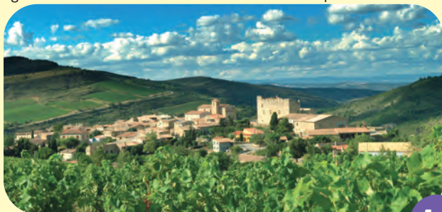
Village de Roquetaillade

Roquetaillade au passé chargé d'Histoire associe la Pierre, l'Eau, le Vent et le Vin. Dominées par le Pic de Brau, ses maisons de pierres sont bâties autour du Château (Xleme) et son Eglise (1635). Dès le mois de Mai des promenades à thèmes sur les "Sentiers d'Eau et de Vent" sont organisées. En Juin "Fleur de Vigne", fête des viticulteurs et des vigneron, honore la vigne et le vin dans une ambiance festive et authentique.